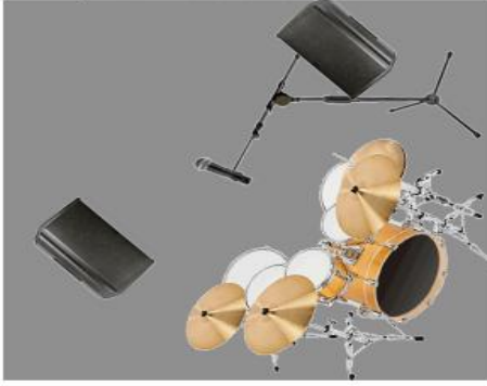
300X300X20 drum riser