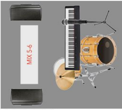
300X300X20 moving drum riser